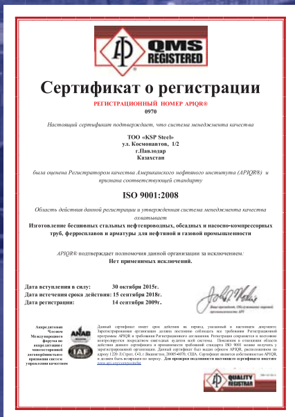
СЕРТИФИКАТ ISO 9001:2008