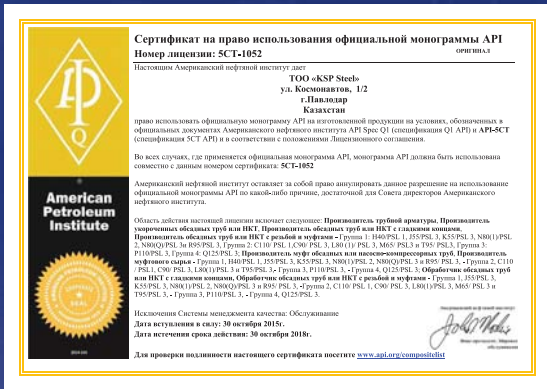
Сертификат на монограмму 5CT_русс_2015-2018