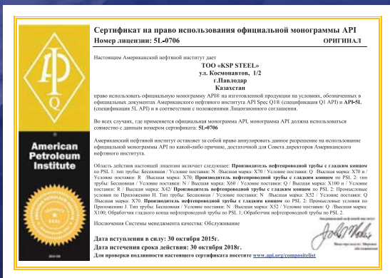
Сертификат на монограмму 5L_русс_2015-2018