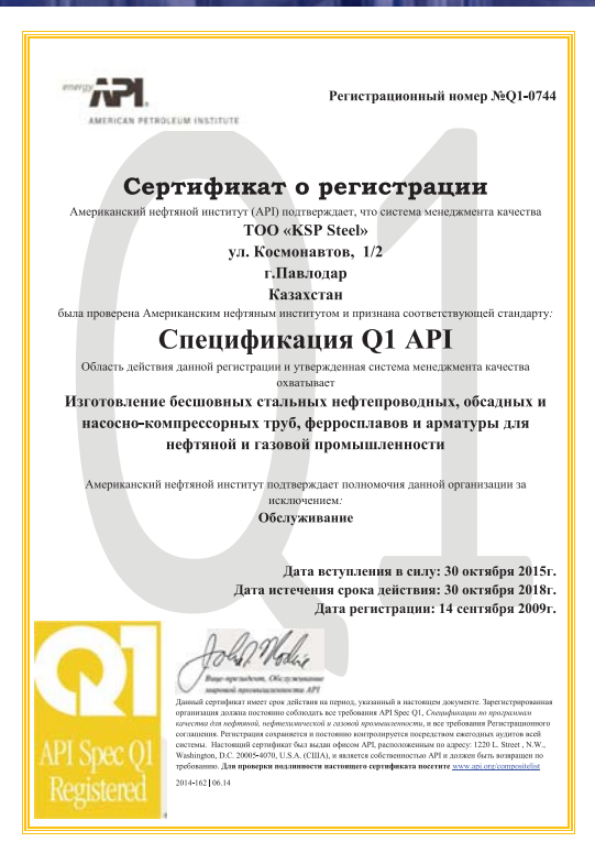
Сертификат на Q1_2015-2018

■ ресертификационный аудит на соответствие системы менеджмента качества требованиям API Spec Q1/ISO TS 29001, ISO 9001:2008, право на использования официальной монограммы API и соответствия продукции требованиям API Spec 5CT, API Spec 5L, проведенный аудиторам Американского института нефти (API)